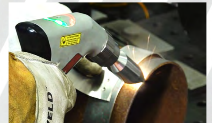
Высокопроизводительный режим очистки до и после сварки