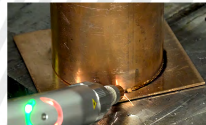
Прочная и герметичная сварка медной трубы толщиной 2 мм к медному фланцу толщиной 3 мм